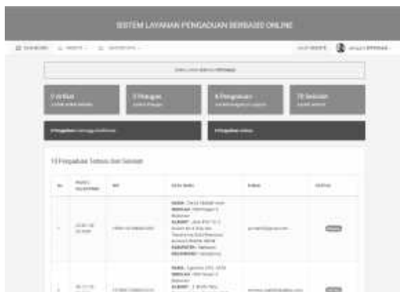
Gambar 3 Tampilan layanan pengaduan berbasis online

Gambar 3 menunjukkan halaman yang menampilkan artikel, petugas, pengaduan, dan jumlah sekolah yang menggunakan aplikasi. Informasi yang didapatkan berupa waktu pelaporan, NIP guru yang melapor, data guru yang mengadai, email, dan status.