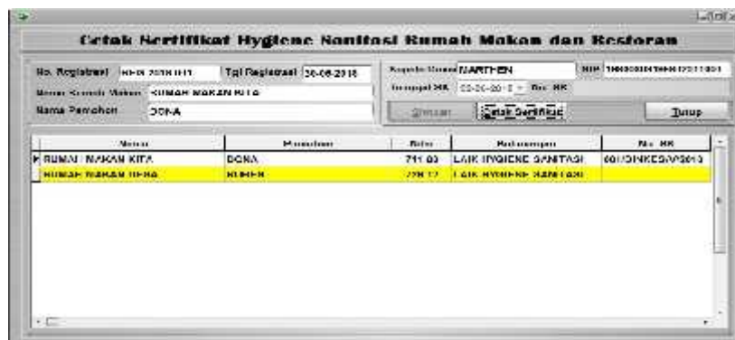
Gambar 7. Tampilan Form Cetak Sertifikat Hygienen Sanitasi Rumah Makan

Untuk form cetak sertifikat hygiene sanitasi rumah makan dapat dilihat pada gambar berikut ini. Form proses cetak sertifikat hygiene sanitasi dirancang untuk mencetak sertifikat hygiene bagi rumah makan/restoran yang dinyatakan laik hygiene sanitasi dengan cara: klik nama rumah makan/restoran, input tanggal SK, input nomor SK, klik tombol simpan, klik tombol cetak sertifikat, klik option preview untuk menampilkan hasil ke layar/monitor, klik tombol Ok.