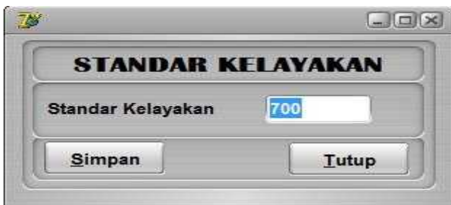
Gambar 4. Tampilan Standar Kelayakan

Untuk tampilan form standar kelayakan dapat dilihat pada gambar di bawah ini::