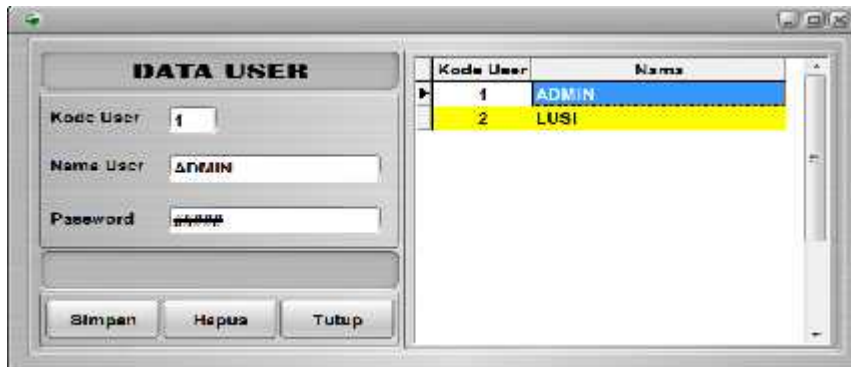
Gambar 3. Form Pengelolaan User

Form pengolahan data user dirancang untuk pengolahan data user berupa: data user yaitu menambahkan data user yang baru ke dalam database dengan cara: input kode user , input nama user , input password dan klik tombol simpan. Form pengelolaan data user dapat dilihat pada gambar berikut: