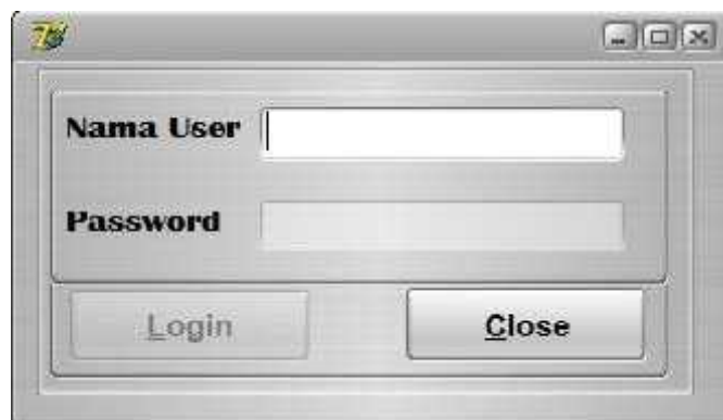
Gambar 1. Tampilan Interface

Form login dirancang untuk login ke dalam sistem penunjang keputusan penilaian hygiene sanitasi rumah makan/restoran dengan bentuk form sebagai berikut: