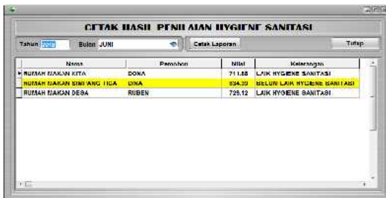
Gambar 6. Tampilan Menu Hewan

Form proses cetak laporan hasil penilaian dirancang untuk mencetak laporan hasil penilaian kelayakan hygiene sanitasi dengan cara: input tahun penilaian, klik bulan penilaian, klik tombol cetak laporan, klik option preview untuk menampilkan hasil ke layar/monitor, klik tombol Ok Untuk form cetak hasil penilaian dapat dilihat pada gambar berikut: